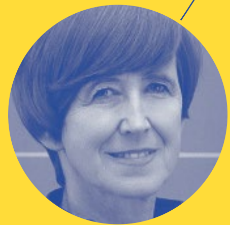
Spotkanie z Elżbietą Rafalską, minister rodziny, pracy i polityki społecznej

91 proc. Polaków zatrudnionych w sektorze MŚP stara się na co dzień ograniczać zużycie energii w miejscu pracy. Na ogół są to jednak działania pracowników, zdecydowanie rzadziej właścicieli firm, szczególnie gdy wymaga to dodatkowych starań. O wnioskach z raportu Lewiatana i Fundacji Poszanowania Energii rozmawialiśmy z dziennikarzami.