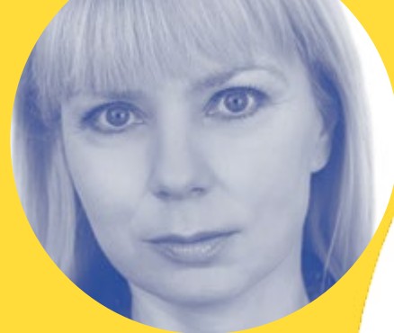
Spotkanie z komisarz UE ds. rynku wewnętrznego i usług Elżbietą Bieńkowską

1 2 3 4 5 6 7 8 9 10 11 12 13 14 15 16 17 18 19 20 21 22 23 24 25 26 27 28 29 30